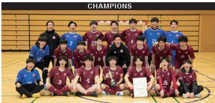
フウガドールすみだファルコンズ (東京)