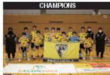
ベスカドーラ町田 U-18 (東京)